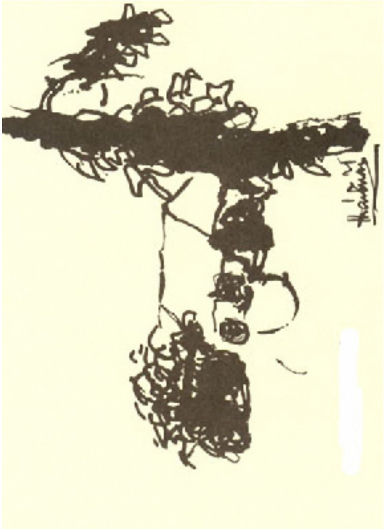
Phụ bản Thái Tuấn