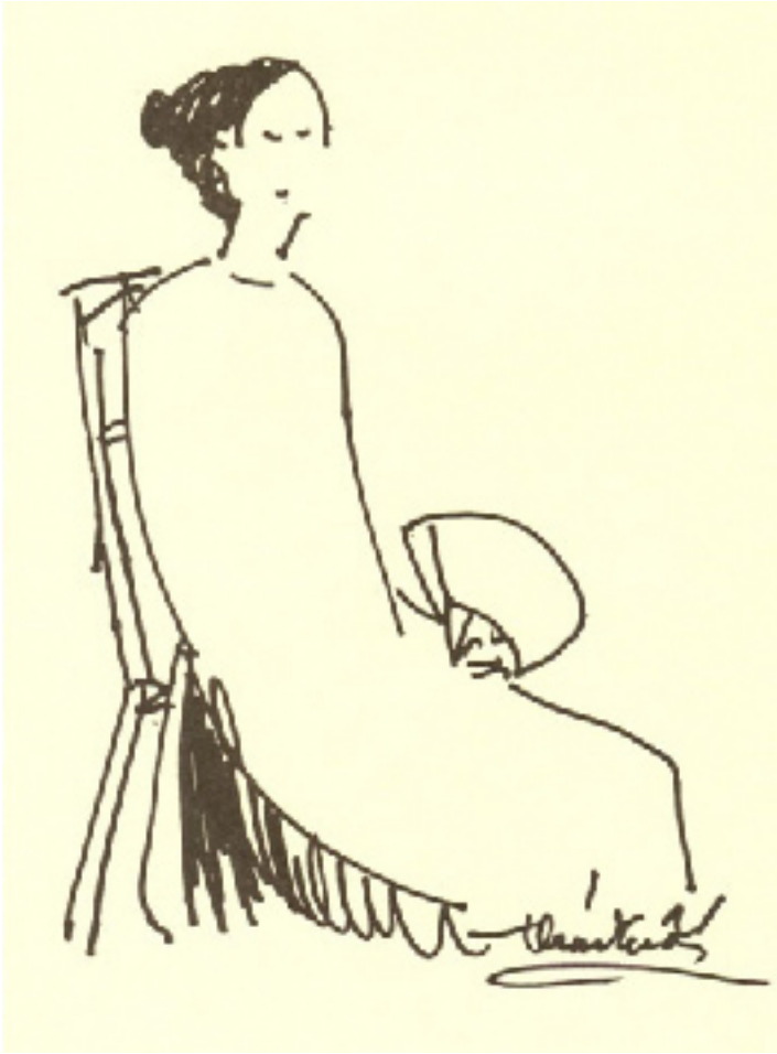
Phụ bản Thái Tuấn