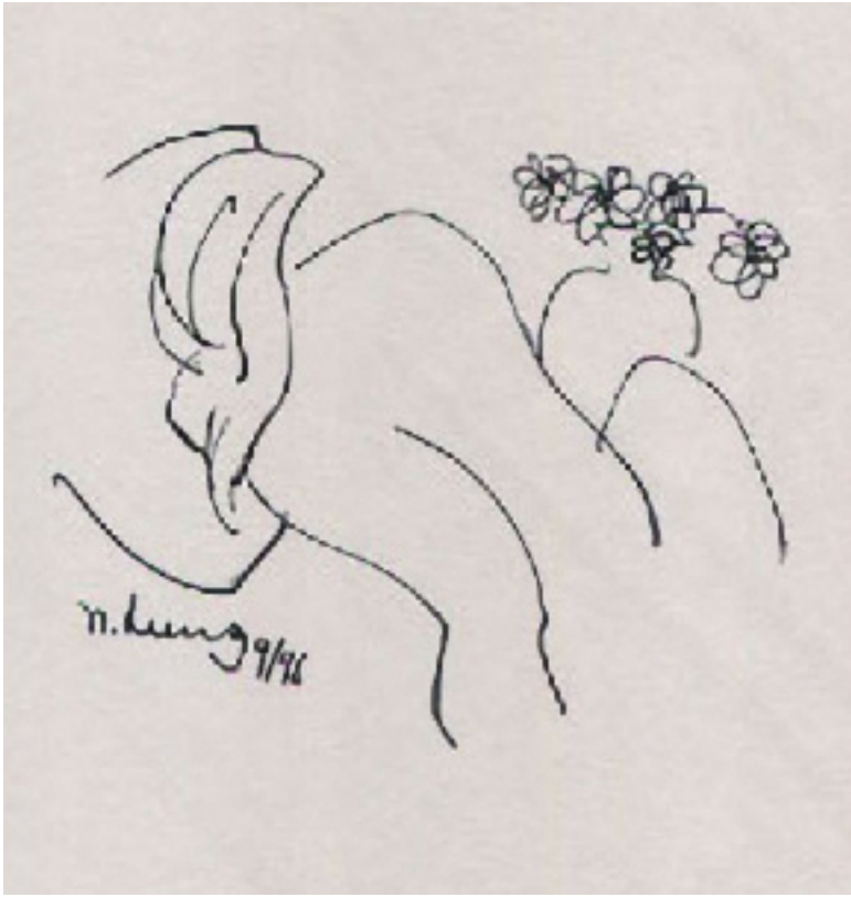
Phụ bản Ngọc Dũng