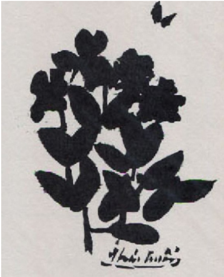
Phụ bản Thái Tuấn